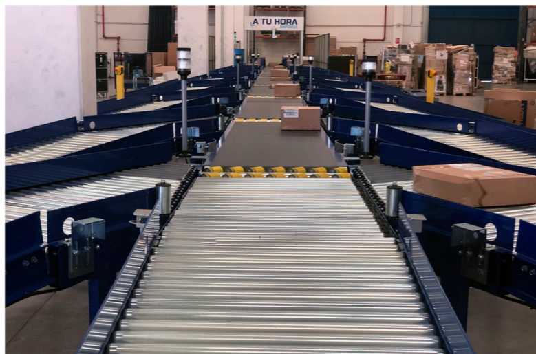
El sorter suministrado por JHernando para A TU HORA EXPRESS les ha servido para mejorar de forma notable la operativa en su HUB central

Nuestro objetivo y, al mismo tiempo, necesidad, era encontrar un sistema de automatización que nos permitiera mejorar los tiempos de clasificación con trazabilidad del paquete en tiempo real. El resultado nos ayudaría a tener una