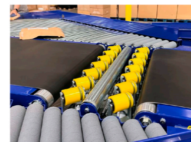
El sistema de clasificación permitirá a A TU HORA EXPRESS mejorar los tiempos de clasificación con trazabilidad del paquete en tiempo real.

¿Qué tipo de paquetes y productos gestionan en mayor medida? ¿Cómo ayuda a su clasificación la tecnología proporcionada por JHernando?