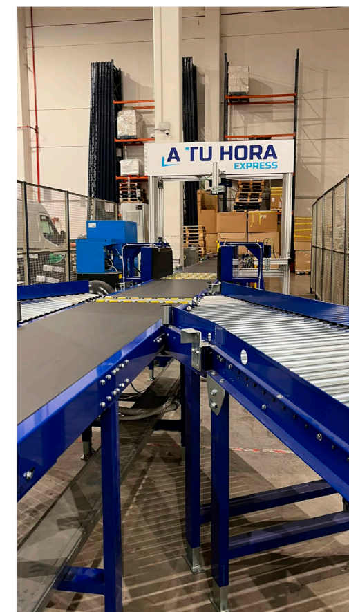
El sorter de JHernando se ha integrado con el sistema de A TU HORA EXPRESS absorbiendo en tiempo real la información de los paquetes.

Hoy en día el m 2 en Madrid tiene un coste muy alto, nuestro negocio tiene picos de actividad en los que necesitamos muchos metros de playa para poder realizar las cargas, y con el sistema clasificador hemos conseguido gestionar un 30% más de mercancía sin tener que contratar más m 2 y conseguir en los picos una actividad fluida sin tensiones de espacio. Ya hemos contratado con JHernando otros sistemas de clasificación para obtener aún mayor capacidad, y queremos automatizar nuestras delegaciones y HUB de intercambio. La automati-